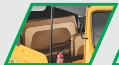
இரு வண்ண கலர் சீட்