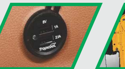
ட்யூயல் USB ஃபாஸ்ட் சார்ஜர்