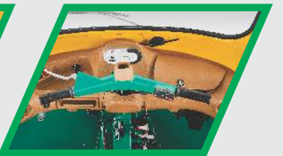
புதிய இன்டீரியர் புதிய டேஷ்போர்ட்