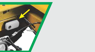
பாதுகாப்பிற்காக என்ஜின் கம்பார்ட்மெண்ட் லைட்