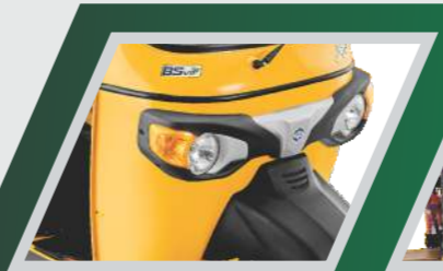
புதிய டிகால் உடன் ஸ்டைலான டிசைன்