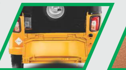
ஸ்டைலான பின் பம்பர்