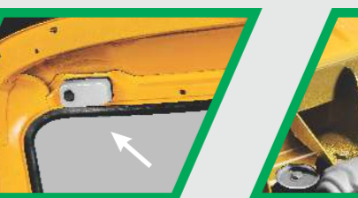
டிரைவர் கம்பார்ட்மெண்ட் லைட்