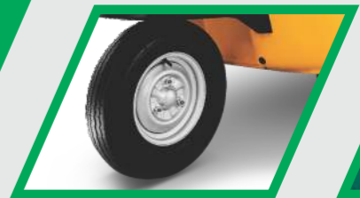
சிறந்த செயல்திறன் மற்றும் நம்பிக்கைக்காக ட்யூப்லெஸ் டயர்ஸ்